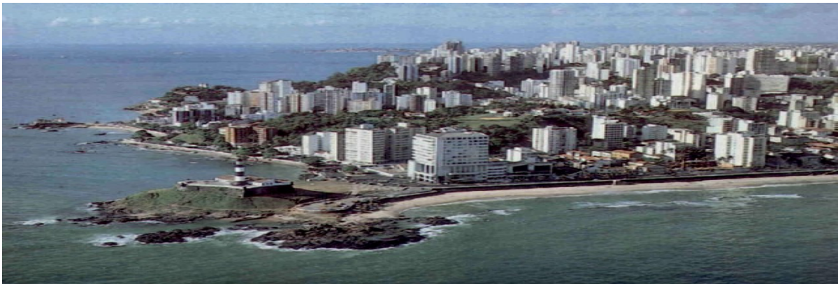
FIGURA 1: Município de Salvador

Minayo (1999, p. 105) conceitua campo como o “recorte espacial que corresponde à abrangência [...] do recorte teórico correspondente ao objeto de investigação”. Assim, a escolha do campo da pesquisa permitiu-nos dialogar com a realidade que queríamos investigar; por isso, definimos como campo de estudo, as Unidades Saúde da Família (USF), do Distrito Sanitário Cabula/Beiru, da cidade de Salvador-BA.