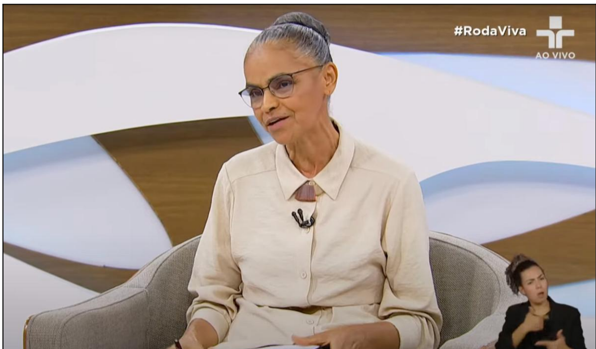
Figura 4 – Captura de tela da entrevista observada nesta pesquisa

Portanto, é uma conceptualizadora acertada para oferecer conceptualizações de “política” ricas, tanto experienciais quanto de princípios e valores. Coincidentemente, ou não, ela foi a pessoa mais entrevistada (12 vezes) pelo programa Roda Viva, em seus 39 anos de TV. Em 2025, ano de publicação desta pesquisa, Marina Silva (Figura 5) é ministra do Meio Ambiente e Mudança do Clima do Governo Lula 3, tendo sido eleita deputada federal em 2022 por São Paulo.